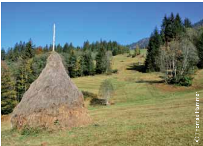
ABBILDUNG 4: Schau-Triste zur Lagerung von Einstreue und Heu in der UNESCO Biosphäre Entlebuch. Bildungs- und agrotouristische Angebote können Einkommen schaffen und zur Pflege der Moorlandschaften beitragen.