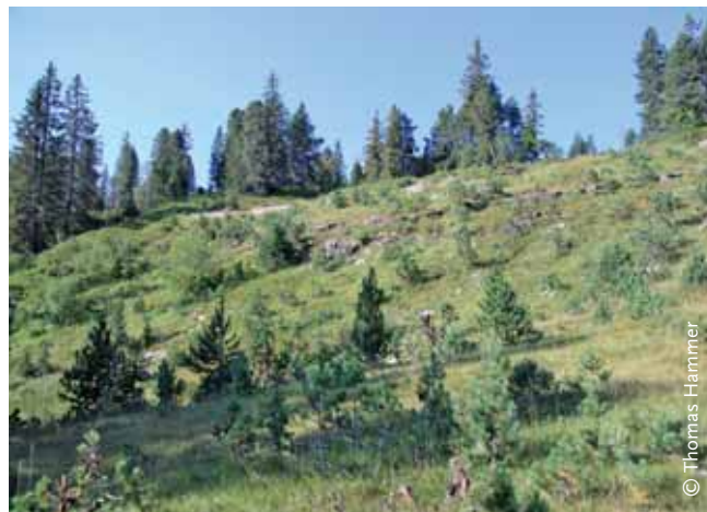
ABBILDUNG 2: Werden periphere alpwirtschaftliche Weiden aufgegeben, drohen sie zu verbuschen und verwalden. Für die Erhaltung der Moorlandschaften ist daher zentral, dass Land- und Alpwirtschaftsbetriebe die Landschaft zielkonform nutzen und pflegen.

auf die Verhinderung unerwünschter Eingriffe. Schleichender nicht zielkonformer Wandel von Moor(landschaft)en, charakteristischen Nutzungsformen und kulturellen Elementen ist unter den bestehenden institutionellen Rahmenbedingungen nicht aufzuhalten. So verschwinden erhaltenswerte landschaftsprägende Kleinobjekte wie Brunnen, Zäune, Gatter, Streuhütten und Käsespeicher aus Holz sowie Strukturen wie Hecken und Baumgruppen zusehends (Abbildung 1). Peripher gelegene Gebiete werden teils nicht länger beweidet, weshalb großen Teilen der Moorlandschaften Verbuschung und Verwaldung droht (Abbildung 2). Dafür wird die Nutzung in Hofnähe häufig intensiviert und nicht zielkonforme Erweiterungs- und Straßenbauten breiten sich aus. Für die Erhaltung der Moorlandschaften ist daher zentral, dass die Land- und Alpwirtschaftsbetriebe die Landschaft zielkonform nutzen und pflegen. Diese Betriebe dabei zu unterstützen ist die künftige Herausforderung.