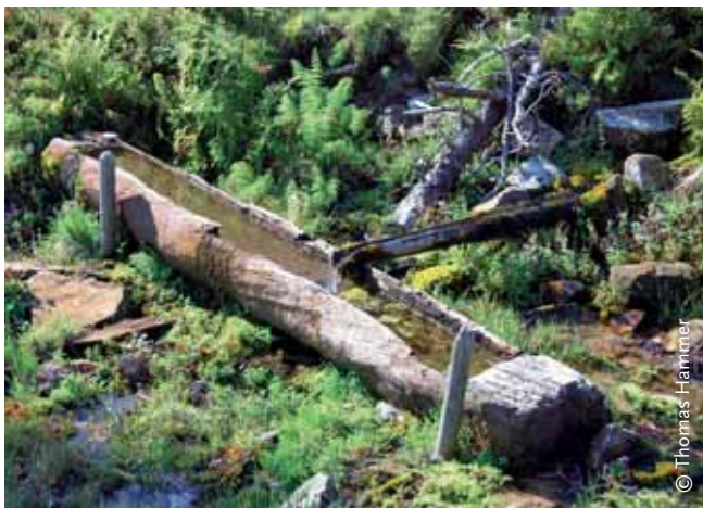
ABBILDUNG 1: Erhaltenswerte landschaftsprägende Elemente wie dieser Brunnen, aber auch Zäune, Gatter, Streuhütten und Käsespeicher aus Holz verschwinden zusehends aus schweizerischen Moorlandschaften. Um sie zu erhalten, wären spezielle Förderprogramme nötig.